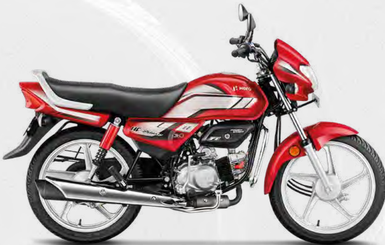
Candy Blazing Red