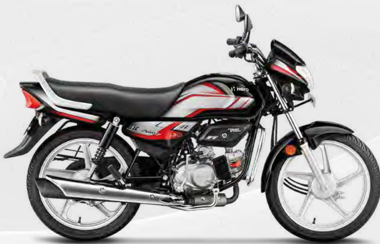
Black With Sports Red