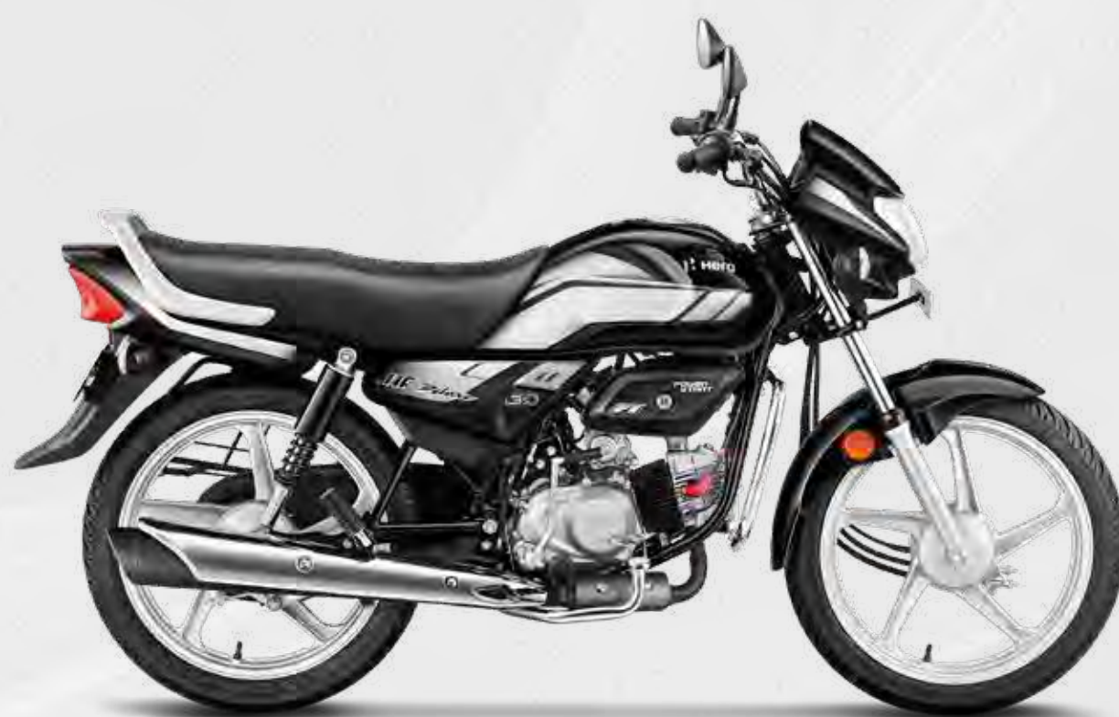
Heavy Grey With Black